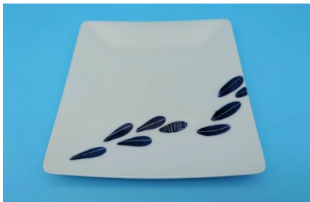
葉っぱ スクエアプレート 5,500円（税込）

端に描かれた葉っぱのデザインが上品なスクエアプレート。前菜やデザートへの盛り付けにぴったりなシンプルかつモダンな一皿です。