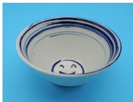
刷毛目内笑顔 反ボール 9,900円（税込）

天に向かってまっすぐに伸びる様子から、成長や繁栄を願う験担ぎとして江戸時代から愛されてきた“十草”をデザインしたボールです。