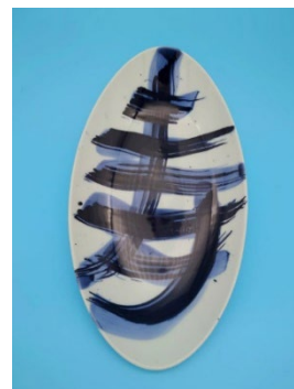
ぼかし寿文字 楕円皿 13,200円（税込）

端に描かれた葉っぱのデザインが上品なスクエアプレート。前菜やデザートへの盛り付けにぴったりなシンプルかつモダンな一皿です。