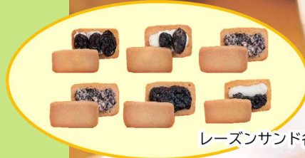
レーズンサンド各6種類