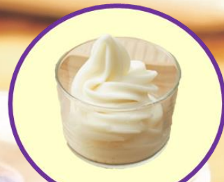
シャインマスカットソフト