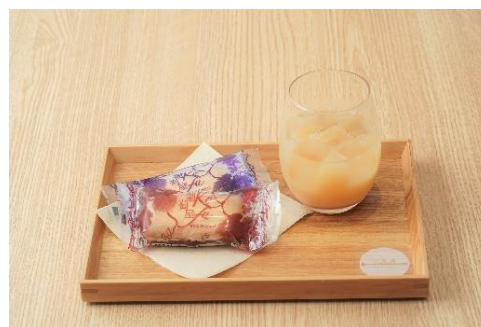
100%桃ジュース レーズンサンド