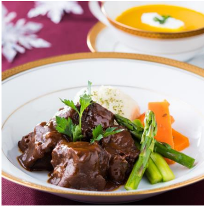
牛ほほ肉の赤ワイン煮とパンプキンスープ ※ 写真はイメージです