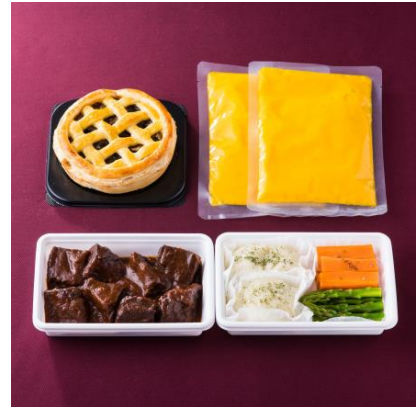
お届けセット内容(2人分) 今回発売のビジネスクラス洋食メニュー

日本空港ビルデング株式会社は、グループ会社であるコスモ企業株式会社の「世界の機内食シリーズ第5弾～ビジネスクラス洋食セット～」を羽田公式オンラインストア「HANEDA Shopping」にて11月29日(月)12時から数量限定で発売します。