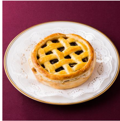
寒い季節にあったかデザート♪ アールグレイアップルパイ