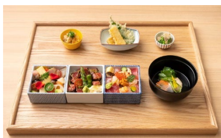
三色華ちらし 2,480 円