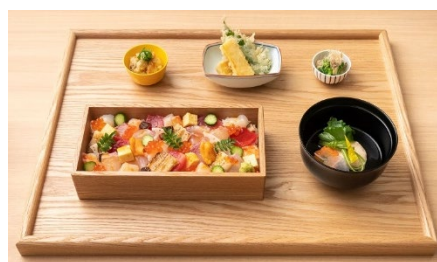
海鮮華ちらし 2,380 円