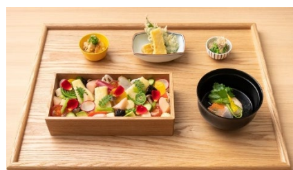
野菜華ちらし 1,680 円