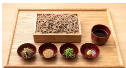
十割そば(もり・かけ)1,000 円