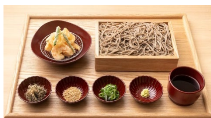
天もりそば(かけ) 1,780 円