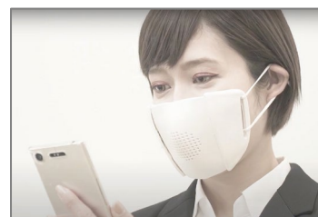
マスク着用のイメージ