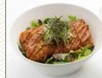
ソースカツ丼 野菜ベースの 特製カツを使用