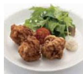
大豆ミート唐揚げ (3個入り)