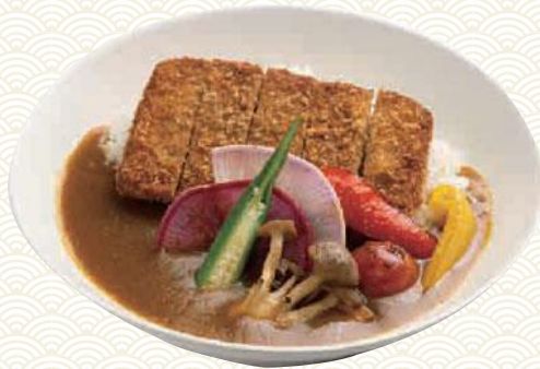
カツカレー 野菜ベースの特製カツを使用 2,250円