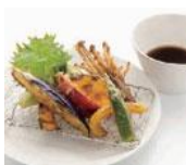
野菜天ぷらの 盛り合わせ