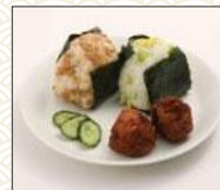
おにぎりと 唐揚げセット (大豆ミートの唐揚げ)